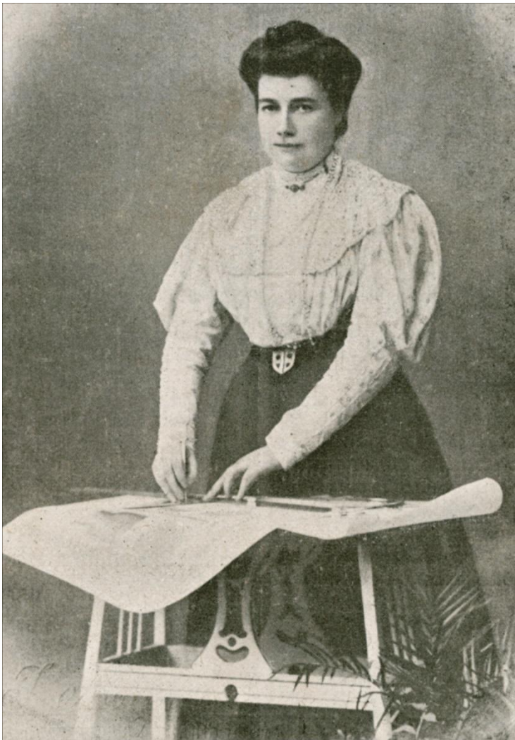
IL·LUSTRACIÓ 1 [FOTOGRAFIA DE LEONOR FERRER, 1908] FLF-LL02-LEONOR_FERRER, FONDS LEONOR FERRER, CARTOTECA DE CATALUNYA

Leonor Ferrer i Girabau (1874-1953) és l'única dona de la que conservem actualment el seu fons documental a la Cartoteca 1 de l'Institut Cartogràfic i Geològic de Catalunya (ICGC). La seva família – una neboda política i els seus renebots - el va dipositar al desembre de 2009 a la Cartoteca amb l'objectiu de que la seva col·lecció cartogràfica personal fos preservada, juntament amb correspondència i altra documentació.