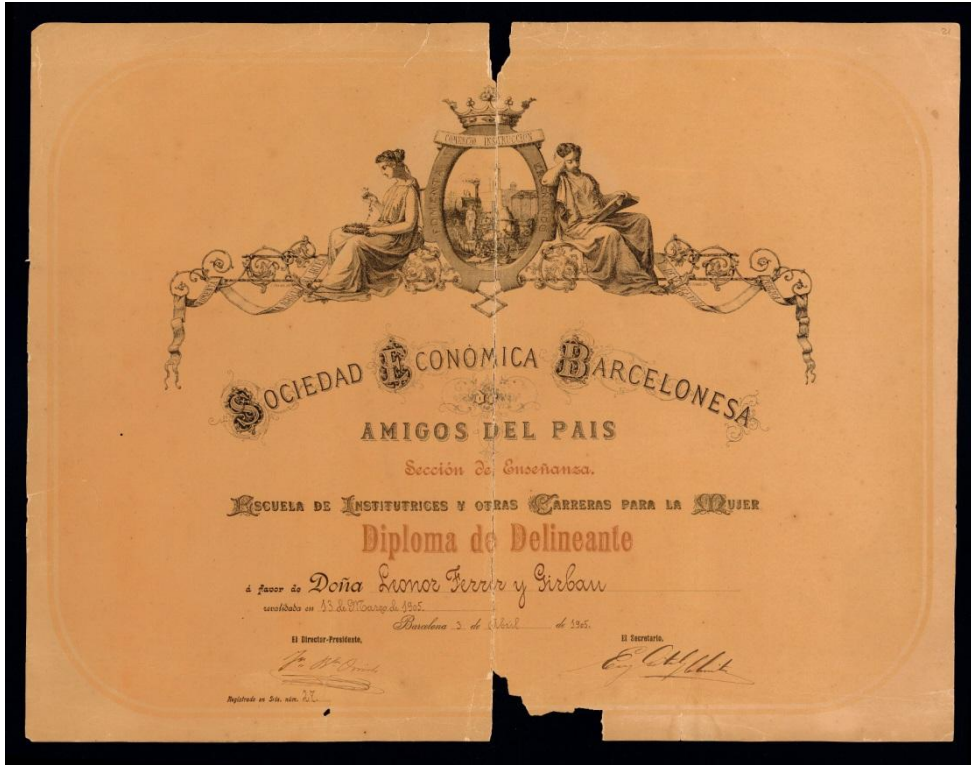
IL·LUSTRACIÓ 2 TÍTOL DE DELINEANT. FLF-LL15-P021, FONDS DE LA LEONOR FERRER, CARTOTECA DE CATALUNYA

d'aconseguir el títol de delineant expedit per la Sociedad Económica Barcelonesa Amigos del País 3 (1905) i va ser la primera delineant de l'estat espanyol 4 .