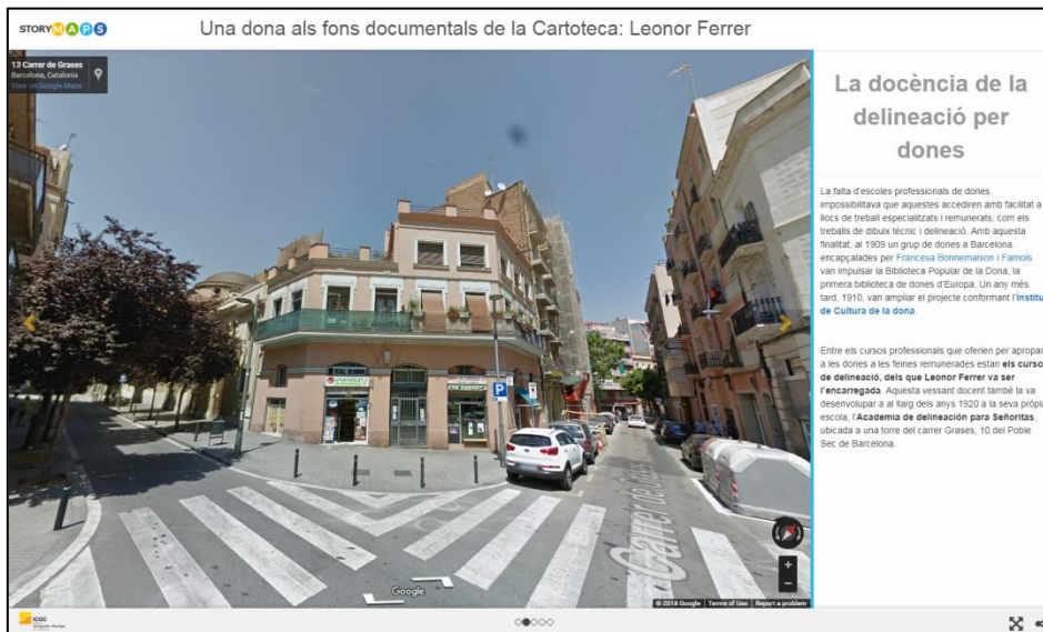
IL·LUSTRACIÓ 6 STORYMAP LEONOR FERRER: GOOGLE STREETVIEW

enllaços a vídeos que ajuden a fer-se una idea del personatge per contribuir a difondre el paper de les dones pioneres en camps molts diversos