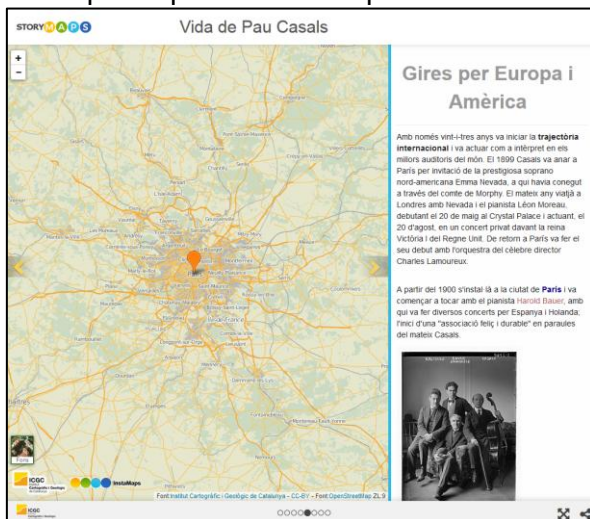
IL·LUSTRACIÓ 3 STORYMAPS DE LA VIDA DE PAU CASALS

Amb l'objectiu de fer servir mapes com a suport d'un discurs es va desenvolupar Storymaps 12 , una eina en línia per crear presentacions dinàmiques que possibilita la inserció de mapes, fotografies, vídeos o qualsevol enllaç web. L'editor és web i la informació s'allotja al núvol de l'ICGC. Amb un storymap el discurs s'enriqueix amb un suport audiovisual i geogràfic que ajuda a fer la narració més visual i entenedora. No només es poden fer storymaps de temes històrics – com el de Leonor Ferrer que presentarem a les Jornades -, també poden ser descriptius o sobre qualsevol altre tema que requereixi d'un suport multimèdia 13 .