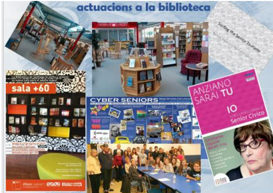
Imatge 3. Algunes accions de diferents països.