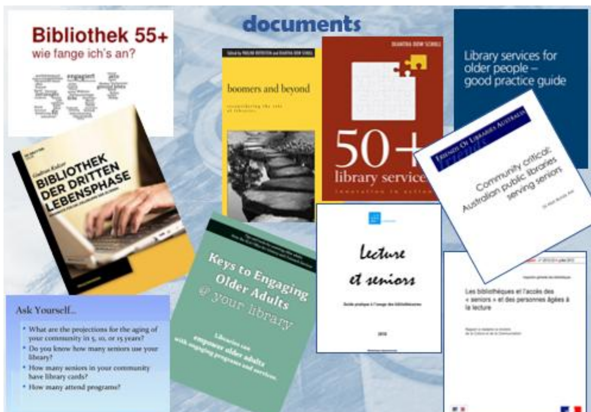
Imatge 2. Exemples de documents de l'ingent producció internacional especialitzada

• Les bibliothèques et l'accès des 'seniors' et des personnes âgées à la lecture. 7 França assumeix la responsabilitat a nivell institucional, amb un important informe, del qual també se'n parla als mitjans de comunicació, dirigit a la Ministra de Cultura i Educació, fet per l'Inspector general de biblioteques.