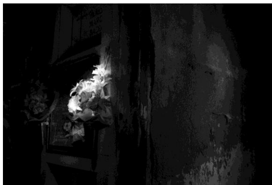
Fotografia premiada: Rugosa i lluminosa , de Sàskia Ferrer i Alsina

El concurs de fotografia del cementiri de Teià neix amb la voluntat de crear un arxiu fotogràfic del cementiri, que es va veure deficient en el moment de l'edició del tríptic, i de captar el públic juvenil. El premi hauria d'enllaçar Teià i Europa i, amb aquesta idea, vam aconseguir 2 passis Interrail Global Pass de 15 dies de 2a classe per al guanyador, gentilesa d'Interrail.