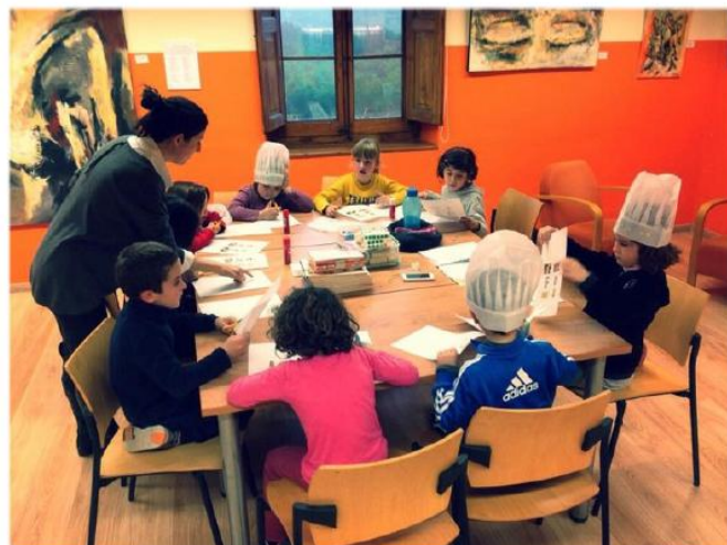
Figura 4. Sessió del Cuinem lletres P.5

El Cuinem lletres vol atrapar els nens al món màgic de les paraules, treballem el significat, la dicció i l'escriptura de les paraules. Donem molta importància al fet d'aprendre jugant, utilitzem tota mena de jocs que ens permetin implicar els nens i fer-los sentir aquella estona com un moment de diversió i entreteniment.