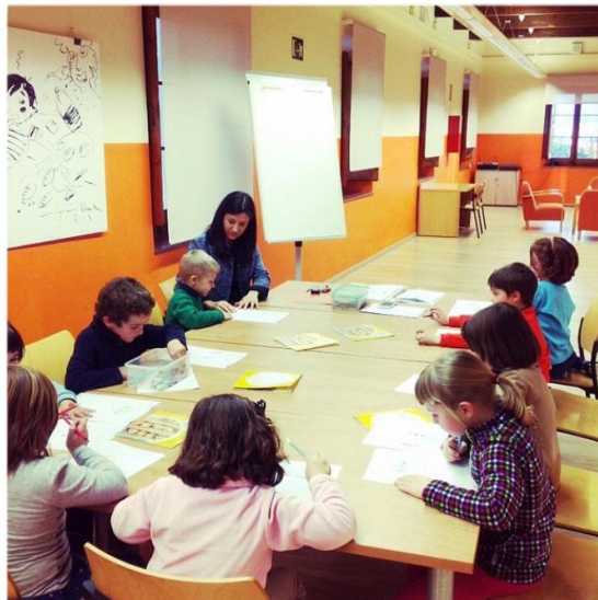
Figura 2. Ara llegeixes tu!

* Com a accions complementàries es porten a terme centres d'interès al voltant de la lectura, jocs de paraules relacionades amb el conte (cadena de paraules, veig-veig, famílies semàntiques), etc.