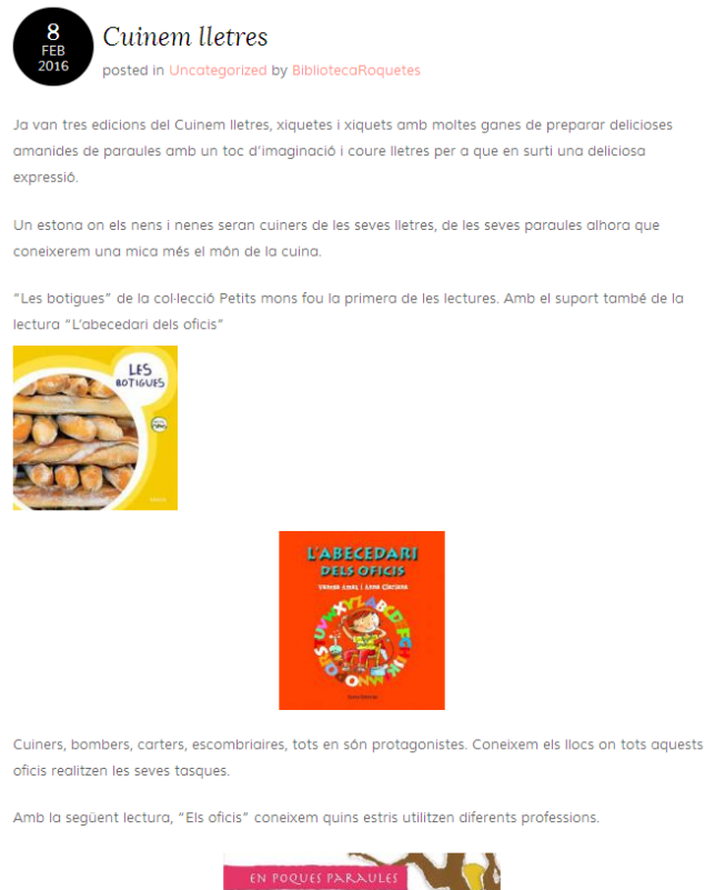
Figura 5. Captura de pantalla de l'apunt Cuinem lletres al Bloc de la Biblioteca

Per a cada sessió del Cuinem lletres es realitza una entrada al blog de la Biblioteca per tal d'informar i difondre l'activitat, els llibres que es treballaran, els motius de la tria i els valors que es fomentaran en cada sessió.