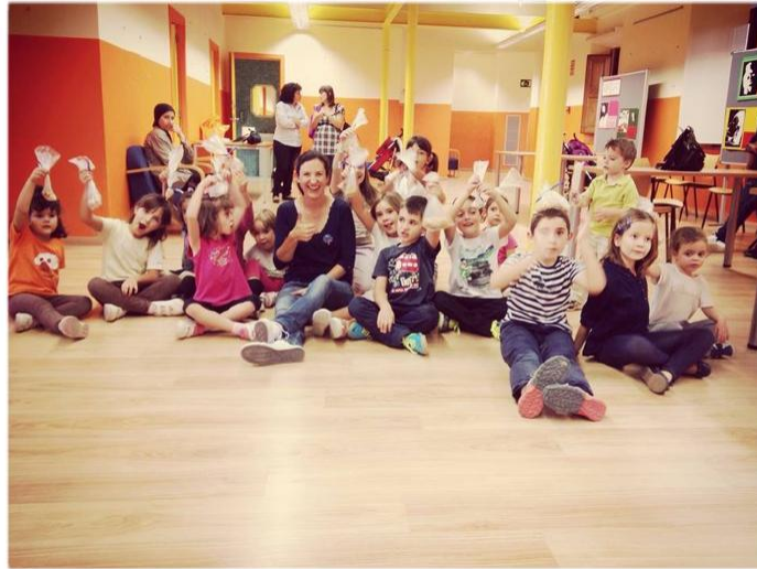
Figura 3. Panellets fets pels assistents de l'Ara Llegeixes tu!

- Cuinem lletres per fomentar l'hàbit lector des de ben petits. Sessió setmanal per a nens i nenes de 5 anys. Hàbits, primers paraules, dicció, jocs didàctics.