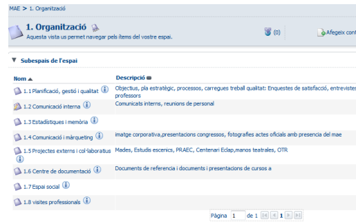
Fig. 1. Gestor documental d'Alfresco