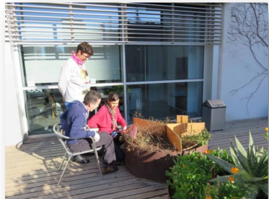
Fig. 3. Assistents al programa «Jardiners» de la Biblioteca Bellvitge