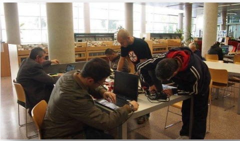
Fig. 1. Revisant els ordinadors portàtils de la biblioteca per al préstec