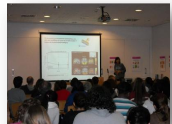
Fig. 6. Conferència de la neurobiòloga Mara Dierssen «Entorn i cervell en les persones amb discapacitat intel·lectual»