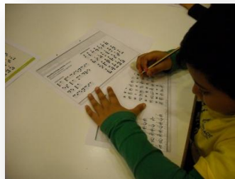
Fig. 5. Taller de llengua de signes i Braille El missatge secret