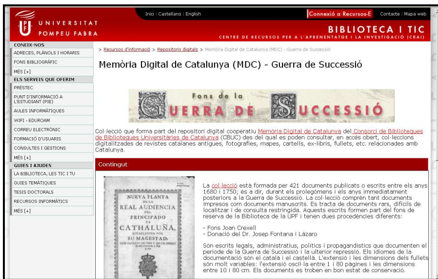
Figura 3. Pàgina de la Biblioteca de la UPF amb informació sobre una de les col·leccions digitals que ha aportat a l'MDC.

Contagion: Historical Views of Diseases and Epidemics is a digital library collection that brings a unique set of resources from Harvard's libraries to Internet users everywhere. Offering valuable insights to students of the history of medicine and to researchers seeking an historical context for current epidemiology, the collection contributes to the understanding of the global, social–history, and public–policy implications of disease. Contagion is also a unique social–history resource for students of many ages and disciplines. 23