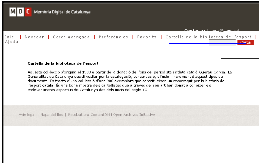
Figura 2. Exemple de notícia inclosa en una pàgina dins de la col·lecció mateixa. S'hi observa que la informació és molt breu, i que no sempre dóna una idea correcta dels materials digitalitzats. En aquest cas, es parla d'uns 900 exemplars de cartells, que corresponen a la col·lecció analògica; de moment, la digital només n'inclou 19.

Les cinc col·leccions de la Biblioteca de la Universitat de Barcelona i les quatre de la Biblioteca de la Universitat Pompeu Fabra enllacen a una pàgina de la institució dedicada a explicar el contingut de la col·lecció digital als usuaris de la pròpia biblioteca. En tots dos casos, la informació s'estructura de manera prou uniforme. La UB inclou els apartats següents: