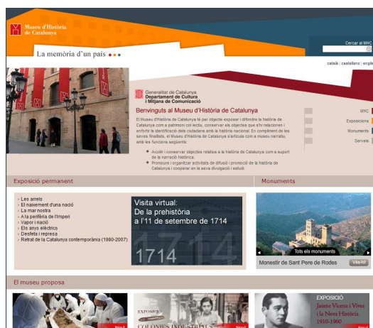
Gràfica 2. Pàgina principal del Museu d'Història de Catalunya, un museu en línia .